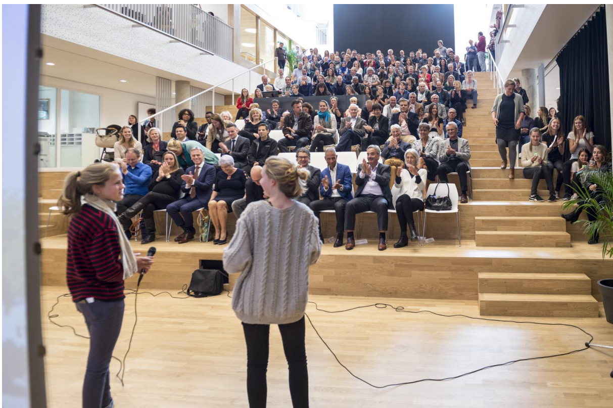
Presentatie door leerlingen