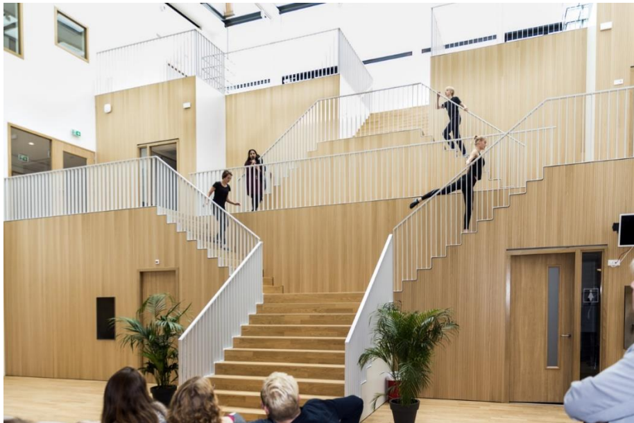
Geweldige performance door leerlingen !