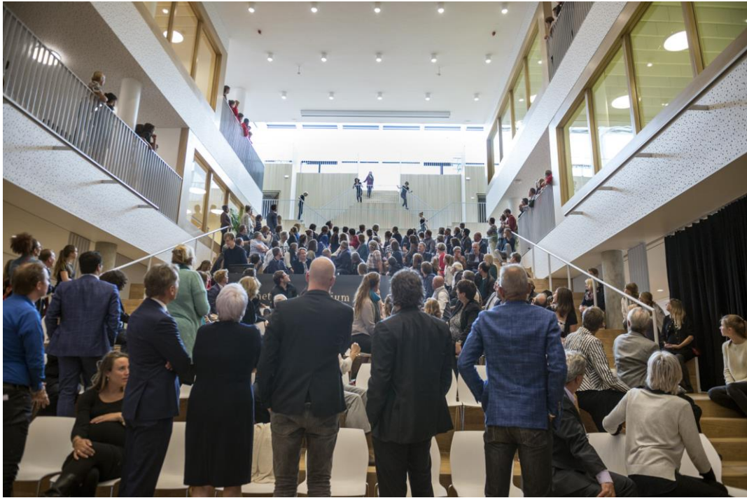
Optredens van leerlingen