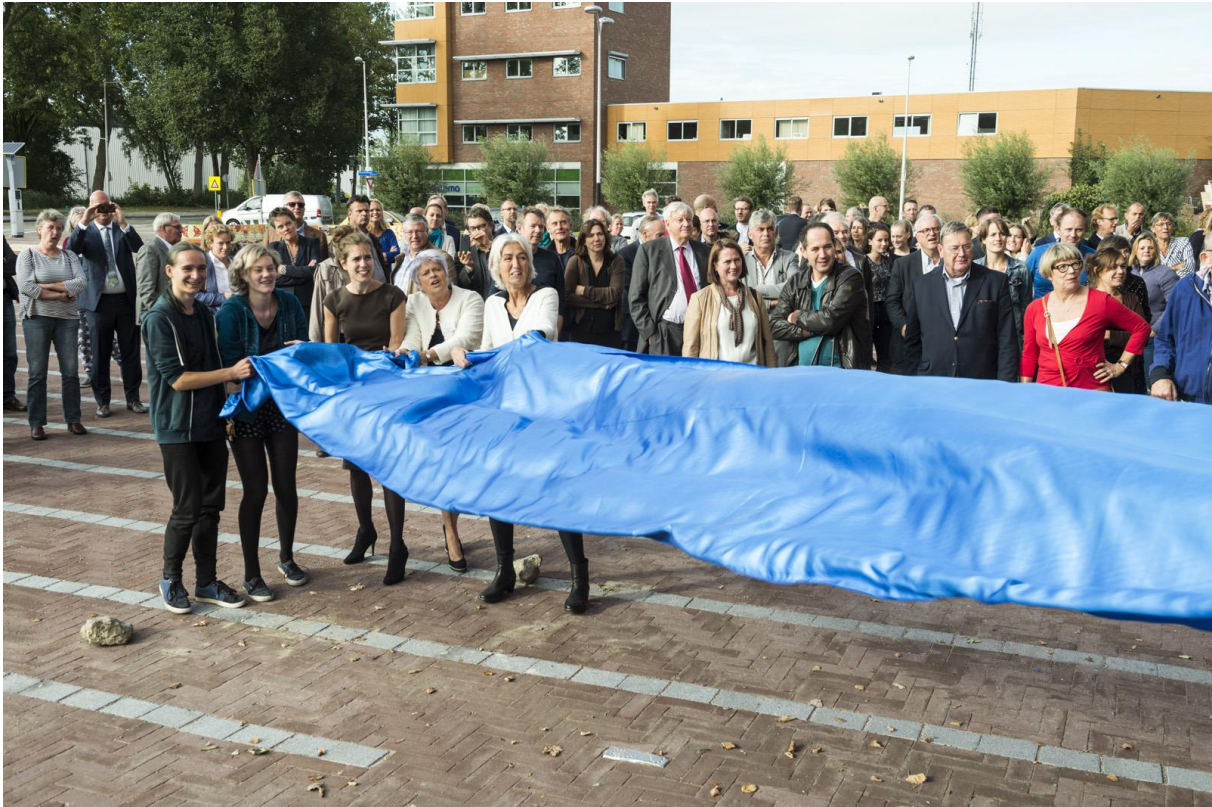
Onthulling van het kunstwerk